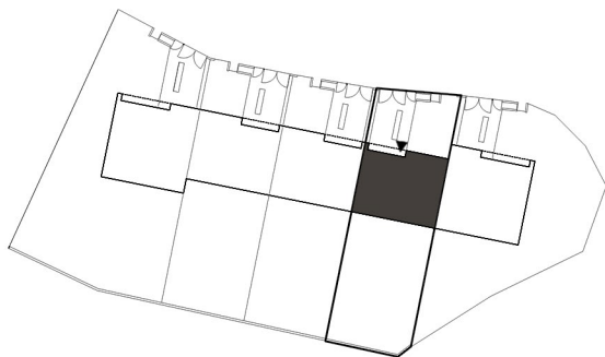
Lokalizacja budynku w kwartale

■ ściany nierozbieralne ■ ściany z możliwością rozbiórki